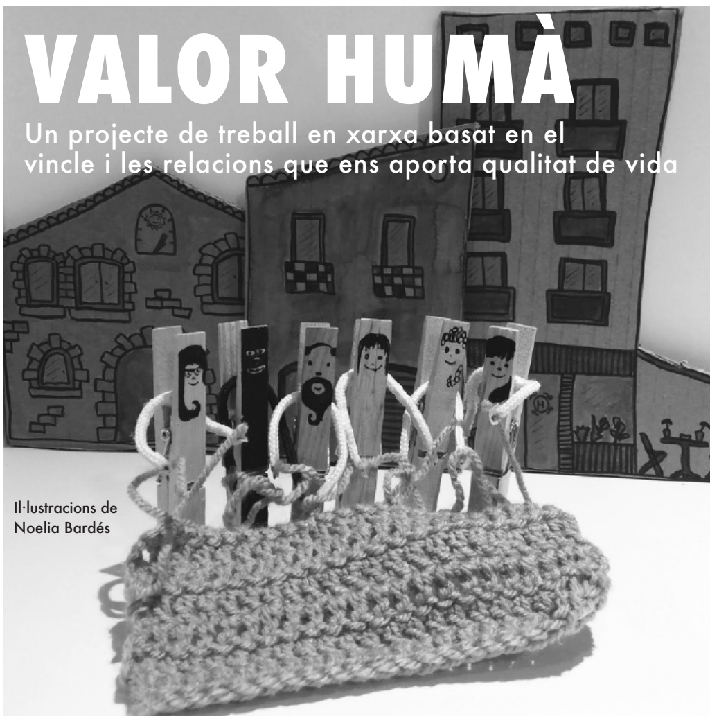
Il·lustracions de Noelia Bardés

Educadores socials inquietes i apassionades per la seva feina, acompanyades per altres professionals amb les mateixes inquietuds i motivacions, de polítics i de les persones per a qui treballen. Més de 25 anys treballant a Platja d'Aro.